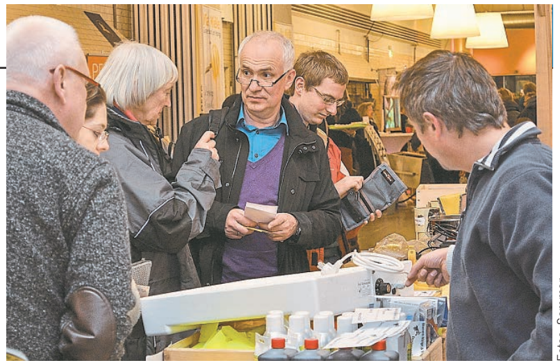
Die Imkermesse ist bei den Apisticus-Tagen ein beliebter Treffpunkt: Gelegenheit zum Fachsimpeln mit Händlern und Imkerkollegen.