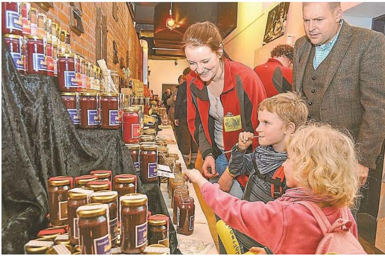
Besucher aller Altersgruppen probierten gerne die Spezialitäten der Schlemmermeile „Via Miele“. Hier gab es Leckeres mit Honig.